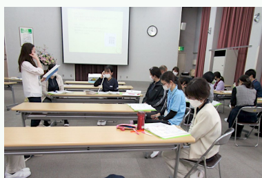
接遇・電話対応の実習