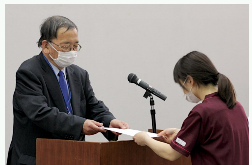
理事長からひとりひとり入職辞令が手渡されました