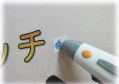
▲ ドット・シートをペン先でタッチすると、録音した音声が再生される

ちなみに、 G-Talk はアマゾンでも販売(¥ 9,720)されています。[“ G-TALK ”全部大文字で検索すると、“無線機”が出てくるので注意して下さいね m(_ _)m] (PT 岸野)