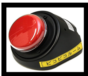
ステップバイステップ