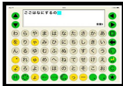
トーキングエイド for iPad

皆さんはAACという言葉を知ったことがあるでしょうか。AACはAugmentative & Alternative Communicationの略で、日本語では「 拡大代替コミュニケーション 」と訳されます。AACは「手段にこだわらず、その人のすべてのコミュニケーション能力を活用して自分の意志を伝えること」で、発話、文字、身振りや手振り、機器の利用など手段を問わないコミュニケーションの手段のことを指します。今回はその中でも、音声によるコミュニケーションが難しい方向けの、機器を使ったAACについてご紹介致します。