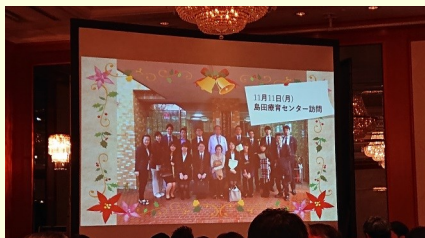
島田療育センター 見学の様子を発表

今年も、株式会社プリンセススクウェア様主催のクリスマスパーティーへ招待いただき、河理事長、木実谷院長、森久保事務部長が出席しました。総額8,450,000円ものご寄付とともに、島田療育センターについて、多くの方へご紹介いただけることを深く感謝致します。