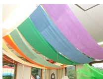
天井の虹 虹に手が届くかも?