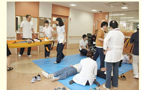
トリアージエリア