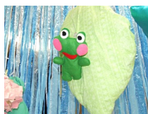
雨の中でも元気な カエルくん