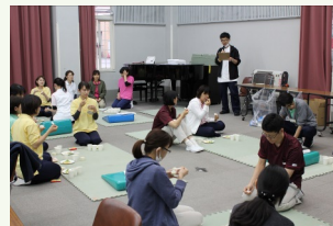
摂食・嚥下の実習