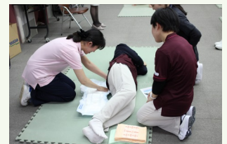
紙おむつの当て方実習