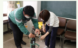
医療ガスの取り扱い実習