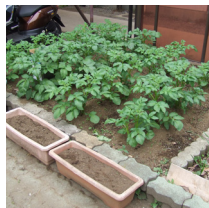
A室前ジャガイモ畑