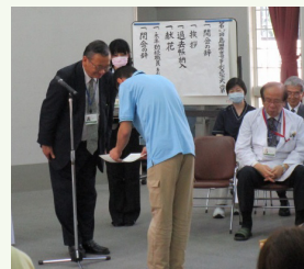
永年勤続職員の表彰