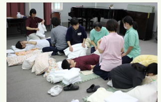
姿勢保持・ポジショニング実習