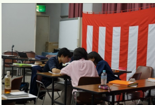
医療安全 危険予知トレーニングのグループワーク