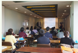
各講師からの講義