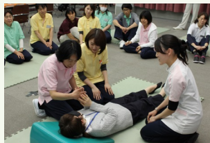
重症児(者)との コミュニケーション実習