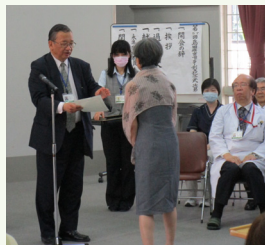
美容ボランティア代表の方へ感謝状の贈呈