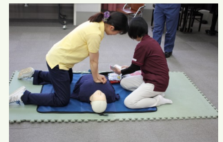
救急時の対応実習