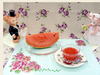
ご奇贈いただいたスイカは、利用者様にはスイカジュレとして提供されました。

毎年、夏にスイカを、クリスマスにはポインセチアとメロンを頂いています。ご家族の意志を受け継いで引き続きご厚意頂けることに深く感謝致します。 (編集委員 岸水 美知恵)