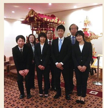
永年勤続表彰者と記念撮影