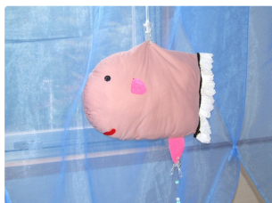
青い海、さわると揺れるマンボウくん。海中散歩はいかが?