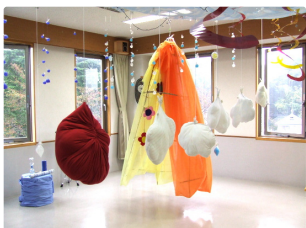
ふわふわ浮かぶ綿の雲、 空中散歩はいかが?